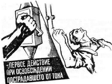
Рис. 1. Освобождение пострадавшего от действия электротока путем отключения электроустановки

БЫСТРОЕ ОТКЛЮЧЕНИЕ от действия электрического тока это первое действие для спасения пострадавшего.