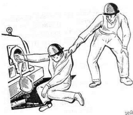
Рис. 3. Освобождение пострадавшего от действия токоведущей части, находящейся под напряжением до 1000 В