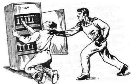
Рис. 4. Освобождение пострадавшего от электрического тока